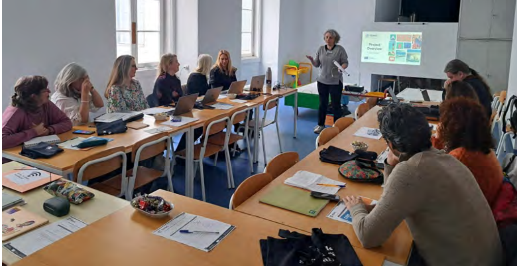
▲ Jornada de trabajo del TEHIC en Lisboa.

Por tanto, este es un proyecto complementario que contribuye al desarrollo de competencias de alto nivel y a mejorar la transferencia de conocimiento en el ámbito del patrimonio cultural y natural en general, y en el de la interpretación del patrimonio, específicamente.